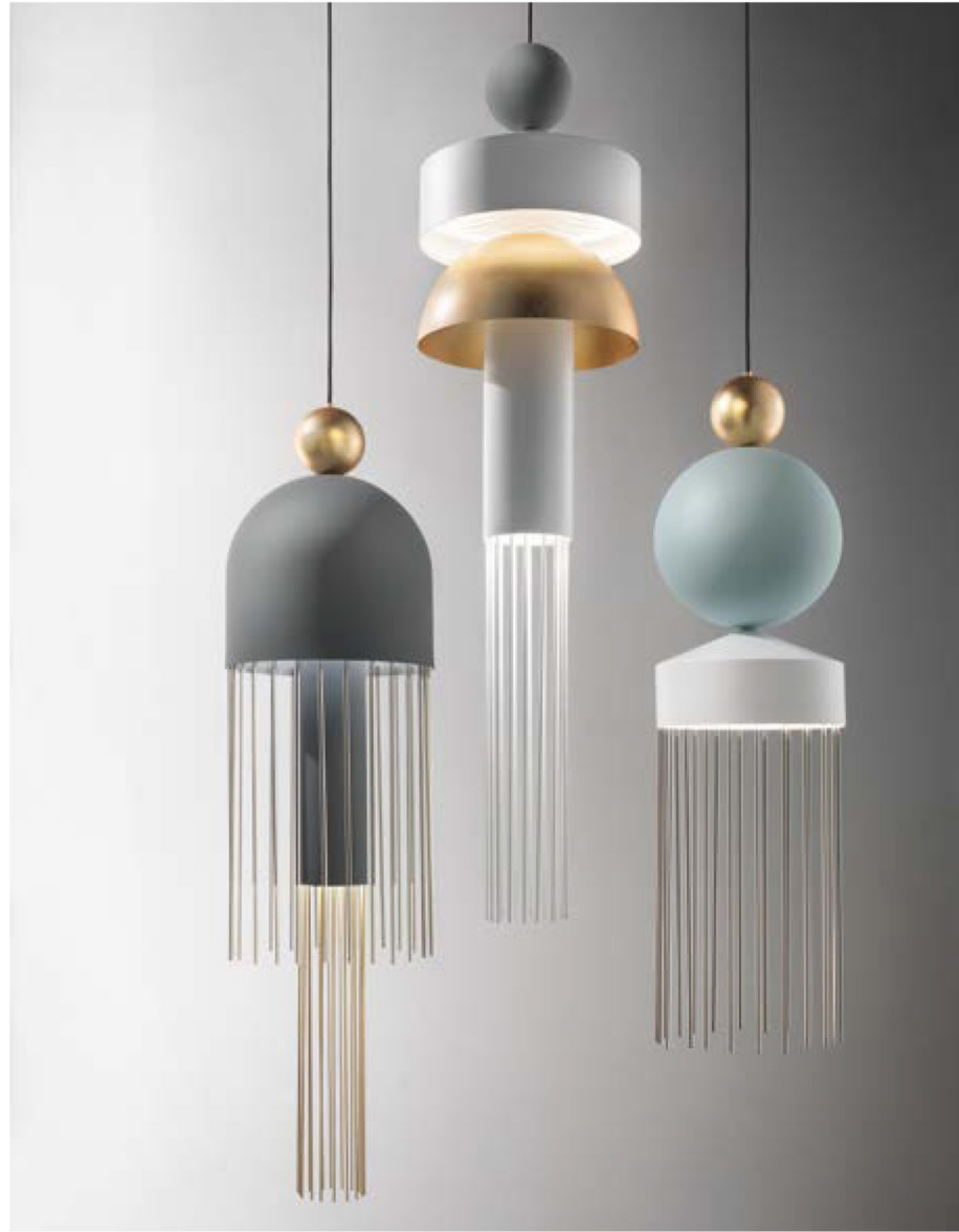
NAPPE XL2 NAPPE XL1 NAPPE XL3