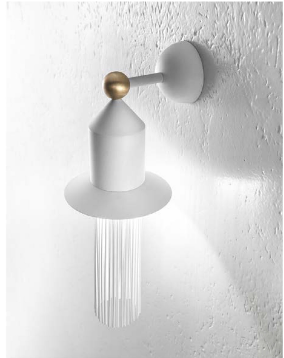
NAPPE APP N2